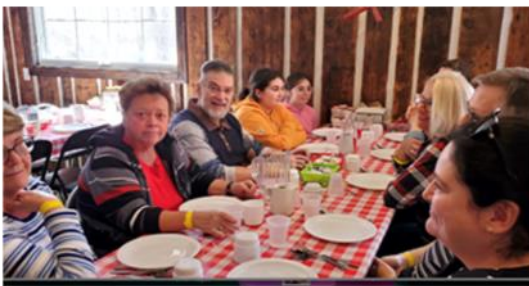
Cabane à sucre Québec