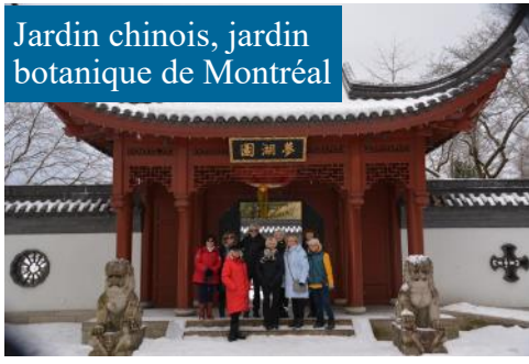
Jardin chinois, jardin botanique de Montréal