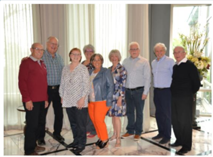
Le nouveau conseil 2024-2026