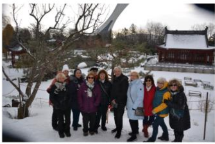
Jardin botanique Montréal